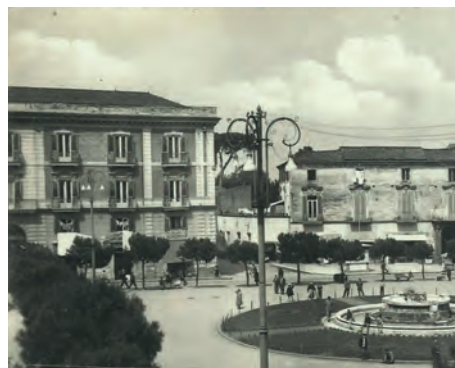
Piazza Vittorio Emanuele III Palazzo Candia, Ruta, Moschetti