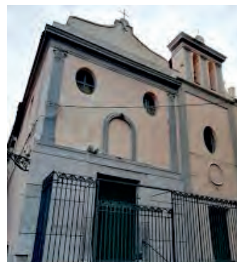
Chiesa "S. Maria della Pietà"