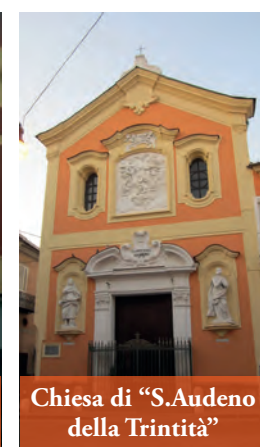
Chiesa di "S. Audeno della Trinità"